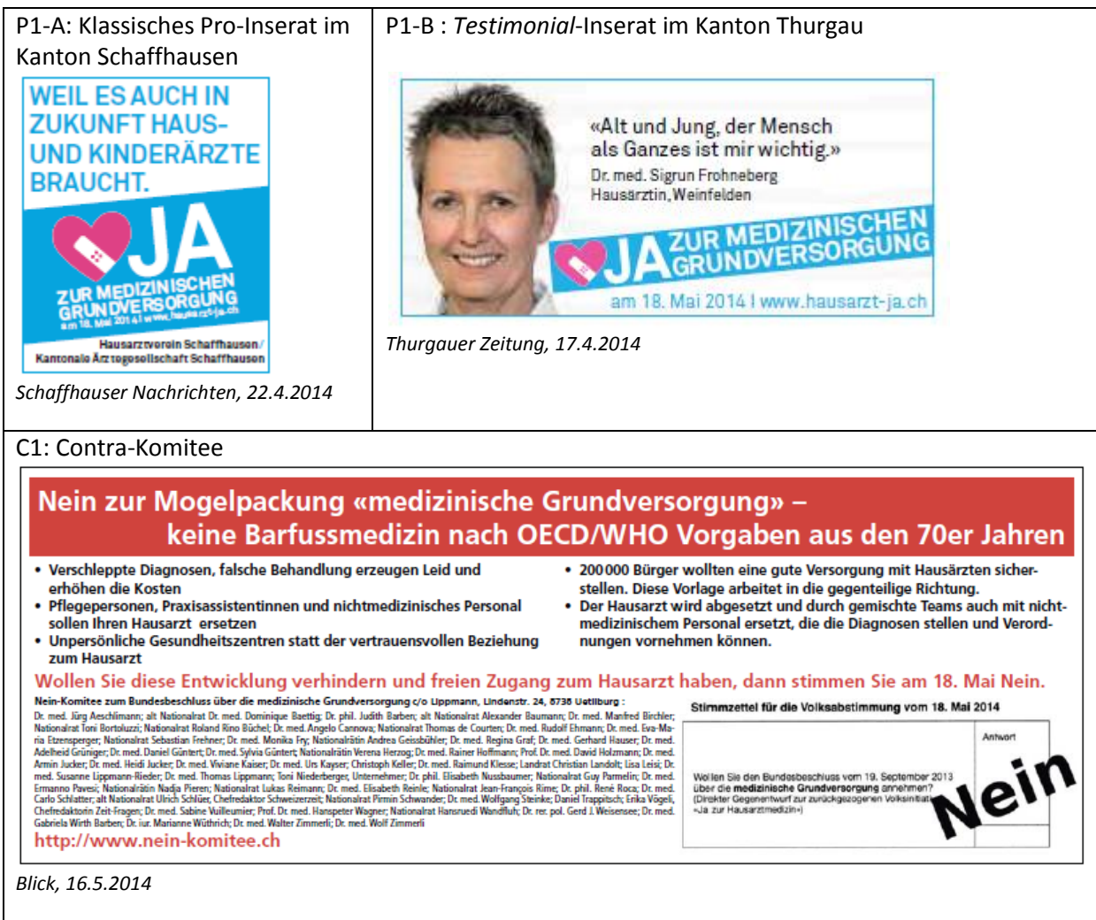
Abbildung 2.1: Illustrative Beispiele der wichtigsten Inseratetypen

Im Folgenden wird zu illustrativen Zwecken ein Überblick über die Hauptinseratetypen vermittelt, die in der Abstimmungskampagne zum Bundesbeschluss über die medizinische Grundversorgung in der Schweizer Presse publiziert wurden. Auf Seiten der Befürworter nahm eine überwältigende Mehrheit von 94% das Sujet des Pro-Komitees an. 4 Wie der Abbildung 2.1 zu entnehmen ist, zeichneten sich diese Inserate durch die hellblau und rosarote Herzen aus.