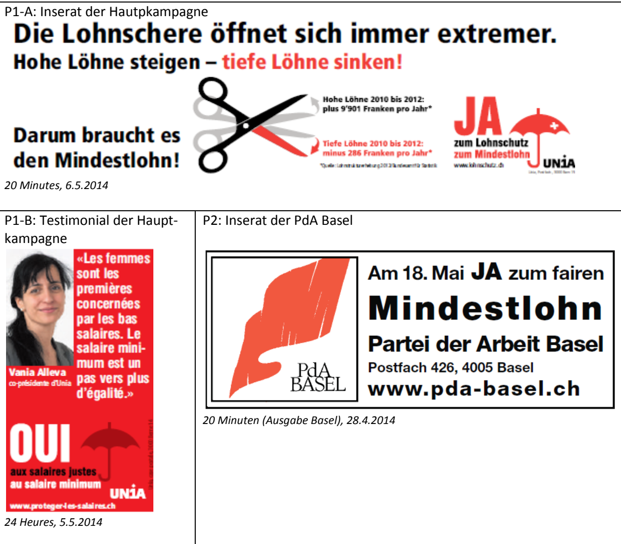
Abbildung 4.1: Illustrative Beispiele der wichtigsten Inseratetypen des Pro-Lagers

Die restlichen 40 Pressenanzeigen der befürwortenden Seite stammten von regionalen Parteien (18 Inserate), regionalen Komitees (15 Inserate) oder regionalen Gewerkschaften (7