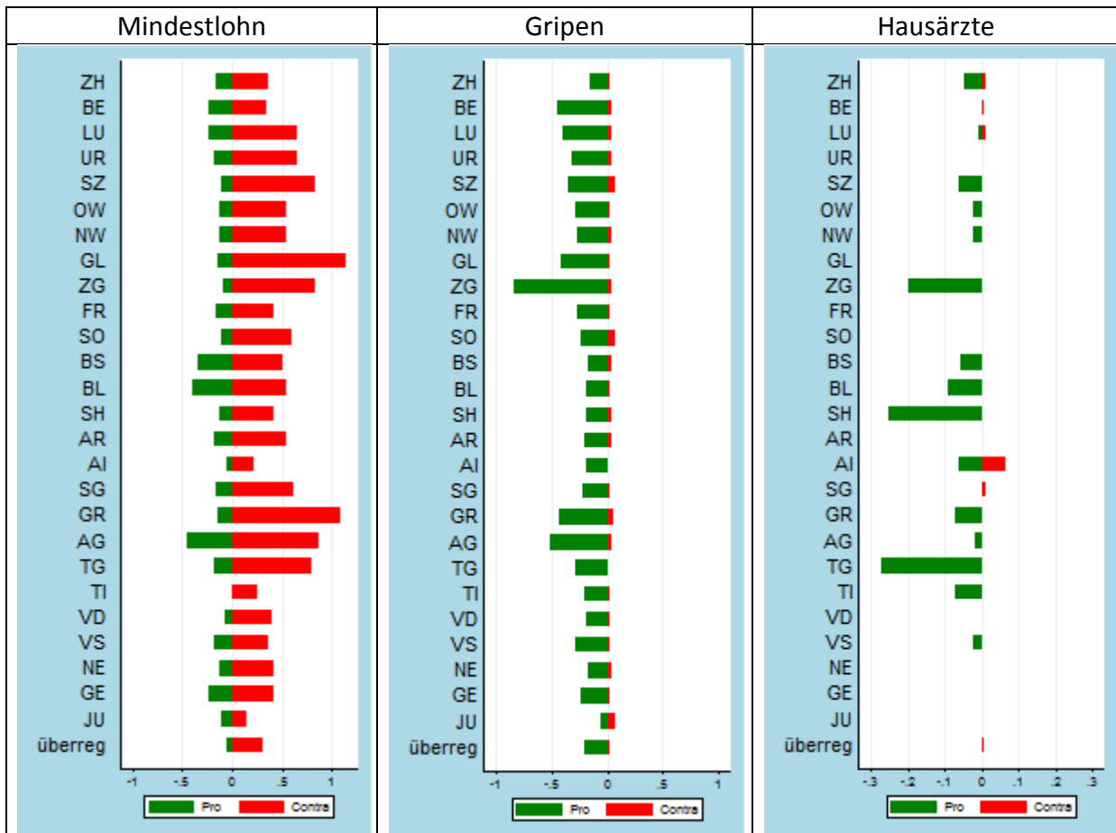
Graphik 1.2: Inserate pro Ausgabe in den Kantonen

Was die Verfassungsvorlage über die Hausarztmedizin betrifft, waren die Befürworter in etwas mehr als der Hälfte der Kantone mit Inseraten präsent. Dabei schwangen deren drei obenaus – Thurgau, Schaffhausen und Zug. Wie aus Kapitel 2 hervorgeht, war diese ausserordentliche Inseratetätigkeit auf regionale Mobilisierungsanstrengungen zurückzuführen. Die Gegner waren ihrerseits lediglich in Regionalzeitungen von fünf Kantonen (AI, BE, LU, SG und ZH) präsent. Dazu schalteten sie einige Inserate in überregionalen Titeln. In Bezug auf die Volksinitiative zur Pädophilie traten die Befürworter – wenngleich auf sehr tiefem Niveau – am stärksten in den Kantonen Aargau, Appenzell-Ausserrhoden, Basel-Landschaft, Solothurn und Thurgau in Erscheinung. Auf Seiten der Initiativgegner fanden sich zwei Inserate im Halbkanton Appenzell-Innerrhoden und eines im deutschsprachigen Gebiet des Kantons Wallis.