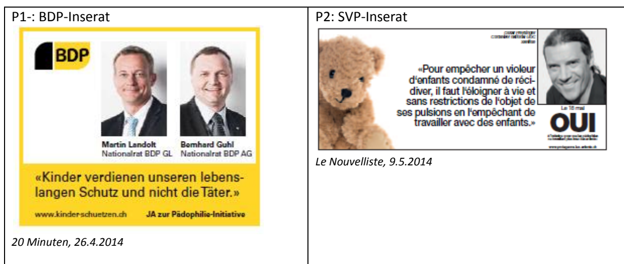
Abbildung 3.1: Illustrative Beispiele der wichtigsten Inseratetypen des Pro-Lagers

Was die Contra-Seite anbetrifft, wurden die Inserate von Parteien aufgegeben. Es handelte sich um die CVP Oberwallis, die SP Appenzell Innerrhoden und um die Gruppe für Innerrhoden (GFI).