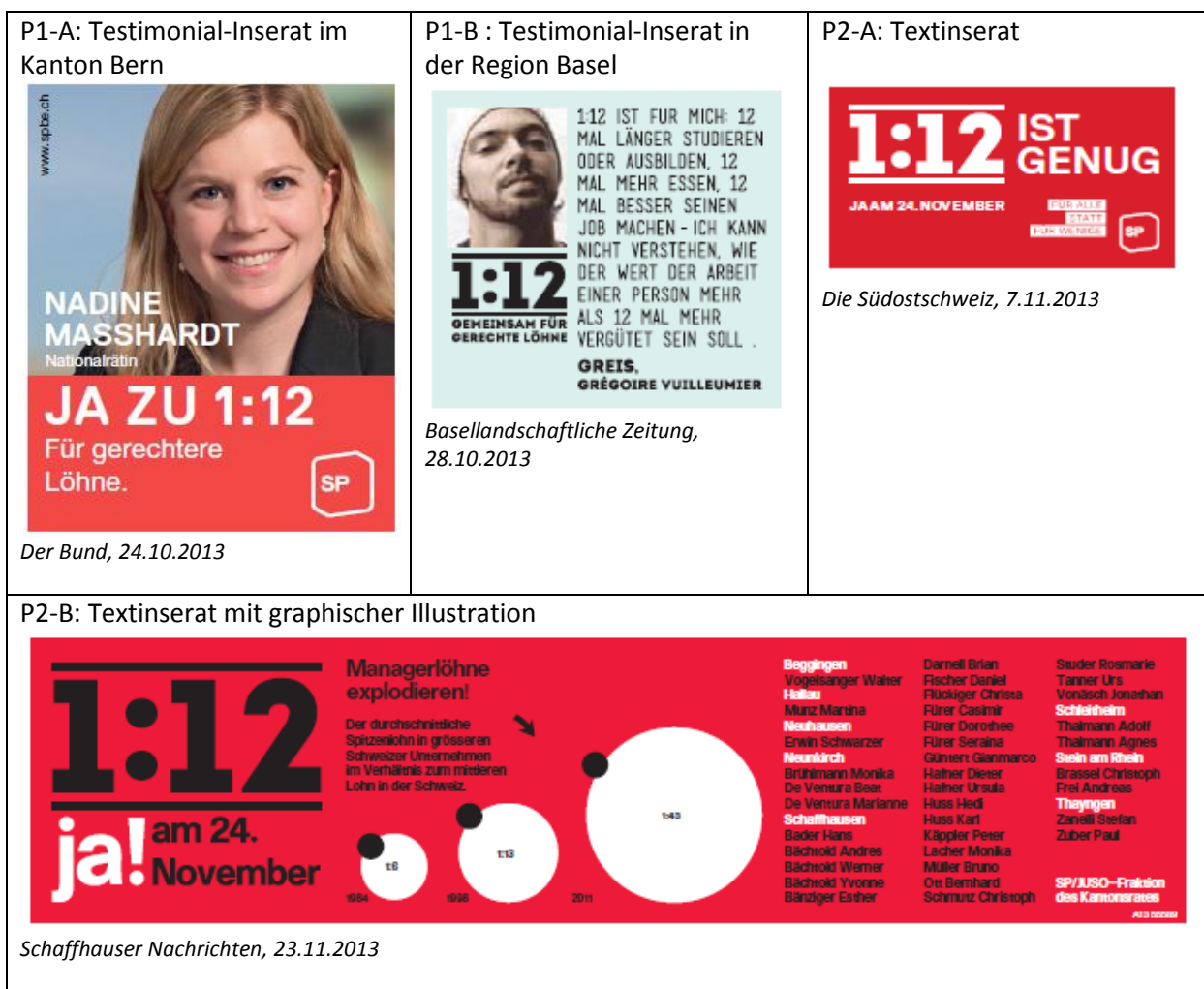
Abbildung 2.1: Illustrative Beispiele der wichtigsten Inseratetypen des Pro-Lagers

In 52% der Fälle griffen die Organisationen des Pro-Lagers auf Testimonial-Inserate zurück. So setzte etwa die SP des Kantons Bern auf ihre eigenen NationalrätInnen (vgl. Typ P1-A in