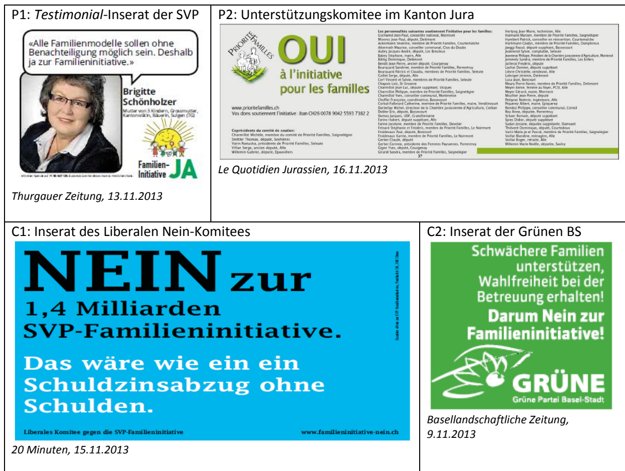
Abbildung 3.1: Illustrative Beispiele der wichtigsten Inseratetypen

SVP-Initiative“ in Erscheinung, während die Aargauische Industrie- und Handelskammer (AIHK) einmal für eine Ablehnung warb. Das Komitee setzte dabei auf ein einziges Sujet, das in der Abbildung 3.1 (Typ C1) abgebildet ist. Auf Seiten der linken Subkoalition stammten sechs Inserate von Parteien (SP und Grüne) sowie zwei von Komitees, denen einzig Akteure aus dem linken Lager angehörten. Ein von den Grünen des Kantons Basel-Stadt aufgegebenes Inserat ist aus der Abbildung 3.1 ersichtlich (Typ C2).