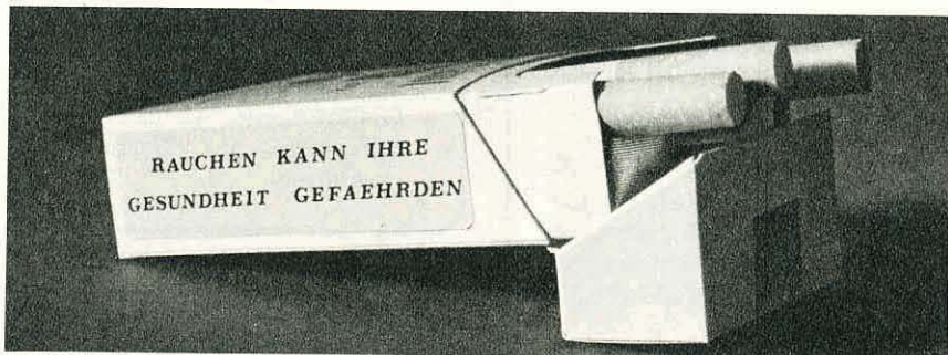
Diese Warnung wird künftig auf jeder Tabakpackung stehen.

Aus allen diesen Gründen empfehlen der Bundesrat und die grosse Mehrheit der Bundesversammlung dem Stimmbürger die Initiative zur Ablehnung.