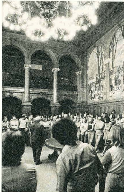
Unter den Besuchern des Bundeshauses finden sich viele politisch interessierte Jugendliche.

Der Kanton Schwyz kennt die Altersgrenze 18 für die Ausübung der politischen Rechte seit 1833; in den Kantonen Obwalden und Zug gehen die Jugendlichen mit 19 Jahren zur Urne. In diesen Ständen ist das niedrigere Stimmrechtsalter völlig unbestritten. Auch im neuen Kanton Jura dürfen nun Achtzehnjährige stimmen und wählen gehen. In mancher Beziehung werden den Jugendlichen bereits vor dem 20. Altersjahr Rechte zugesprochen und Pflichten abverlangt . Viele junge Leute stehen