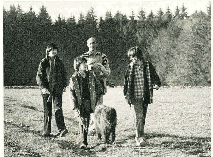
Wandern bedeutet sinnvolle Erholung.

Seit Jahrzehnten haben beim Ausbau der Fuss- und Wanderwege private Organisationen, insbesondere kantonale Wanderwegorganisationen und die Schweizerische Arbeitsgemeinschaft für Wanderwege eine Pioniertätigkeit entfaltet. Für die rechtlichen Belange hat sich besonders die Arbeitsgemeinschaft Rechtsgrundlagen für Fuss- und Wanderwege eingesetzt. Jetzt kann diese wertvolle Arbeit wirkungsvoll koordiniert werden. Bund und Kantone sollen auch eng mit den betreffenden Organisationen zusammenarbeiten.