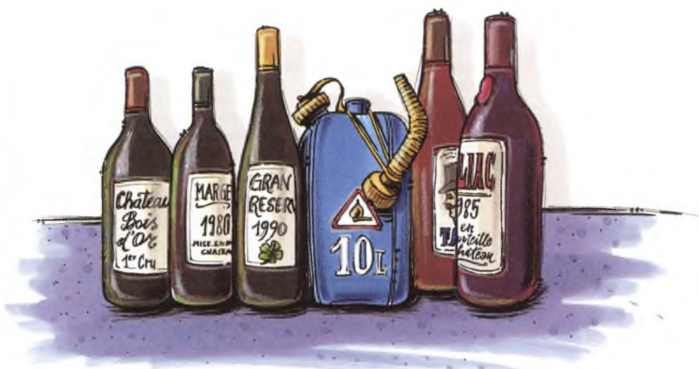
Ein Kanister Benzin bald so kostbar wie eine gute Flasche Wein?