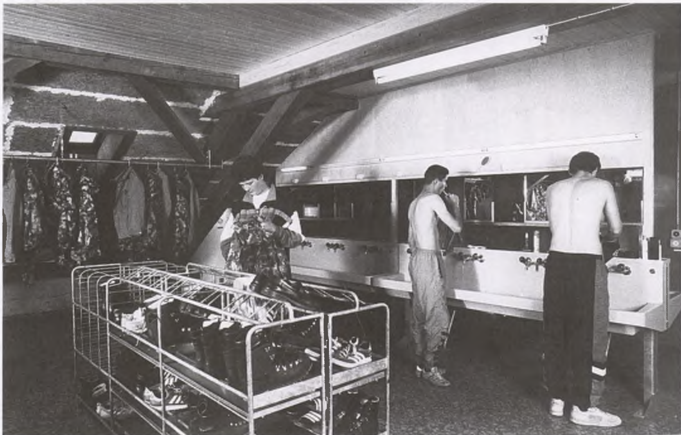
Alte Unterkunft in der Kaserne Herisau