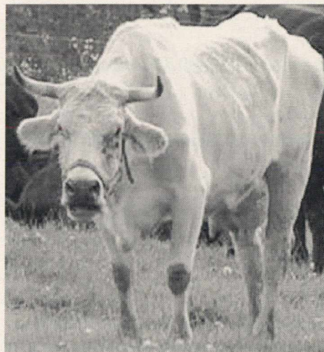
Loorenhof Kuh Monate nach Zwangsimpfung

Die amtliche Dokumentation häufig auftretender Impfschäden und deren Entschädigung sind nicht gewährleistet.