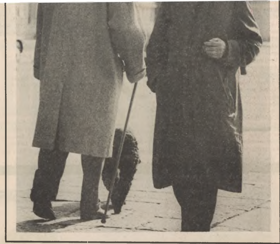
Zurück zum Almosen-Staat oder vorwärts zu einem menschenwürdigen Leben auch nach der Pen- sionierung? Die Antwort heisst: Ja zur 9. AHV-Revision.

Aber auch die Rentner tragen zur Konsolidierung bei durch Neufestsetzung der Grenzen für die Ehepaarsrente und der Zusatzrenten für Ehefrauen. Daneben werden die Beiträge der gut verdienenden Selb- ständigerwerbenden, die man 1969, als Geld im Überfluss vorhanden war, kürzte, mass- voll erhöht. Nicht erhöht, son- dern herabgesetzt werden die Beiträge der Selbständigerwer- benden, die ein steuerbares Einkommen von weniger als 24 000 Franken haben. So müs- sen heute Selbständigerwer- bende mit einem Einkommen von 21 000 Franken 7,3 Pro- zent an die AHV zahlen, neu nach Annahme der 9. Revision nur noch 6,5 Prozent. Die