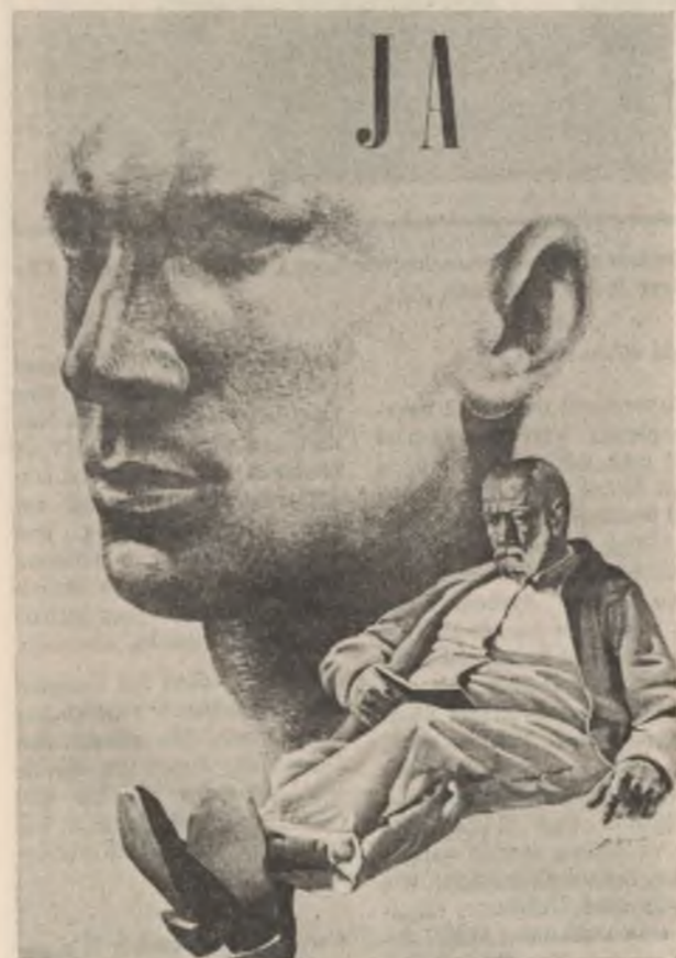
Hans Erni, der bekannte Grafiker und Künstler, hat 1948 an der Wiege der AHV für dieses bedeutende Sozialwerk geworben. Jetzt, wo es um das Überleben der Altersversicherung geht, stellt er erneut seine künstlerische Gestaltungskraft für die 9. AHV-Revision zur Verfügung.

● dass ein Steuerbeamter, der über Fluchtkapital aus einem Entwicklungsland etwas erfahren will, sich durch sein Fragen strafbar macht, während ein Arbeitnehmer über sein Einkommen zu unbedingter Auskunftserteilung verpflichtet ist?