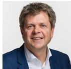
Jürg Grossen GLP