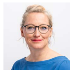
Aline Trede Grüne