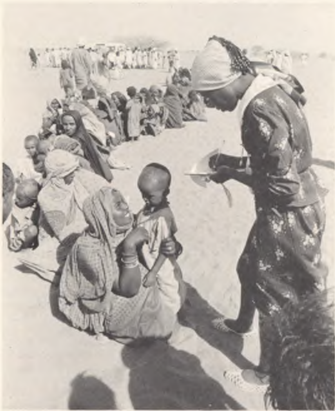
Auf der Flucht vor dem Hunger: Sudan 1986.