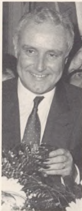
Bundesrat Flavio Cotti

Die beiden «Neuen» schafften den Einzug in den Bundesrat gleich im ersten Wahlgang. Den beiden offiziellen Kandidaten der CVP-Fraktion erwuchs einzig «wilde» Konkurrenz aus dem eigenen Lager: Die Luzernerin Judith Stamm und der andere Tessiner, Fulvio Caccia, blieben jedoch chancenlos: Sie wurden vor allem von der Linken im Rat sowie von den Grünen unterstützt.