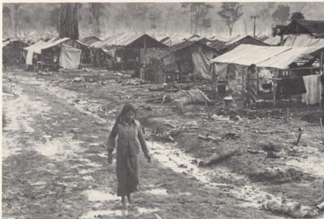
Flucht vor Verfolgung und Unterdrückung: Flüchtlingslager in Thailand.

und Ortega die Marschrichtung mit. Die Vereinigten Staaten stehen unter dem Druck Mexikos. Mexiko steht unter Druck von seiten anderer zentralamerikanischer Staaten. – Eine Konferenz von Fachleuten im kalifornischen La Jolla versuchte dieser Tage, die Wanderungsbewegungen nachzuzeichnen: Nicaraguaner nach Costa Rica, Bolivianer nach Argentinien, Kolumbianer nach Venezuela, Haitianer in die Dominikanische Republik. Das gastfreie, aber