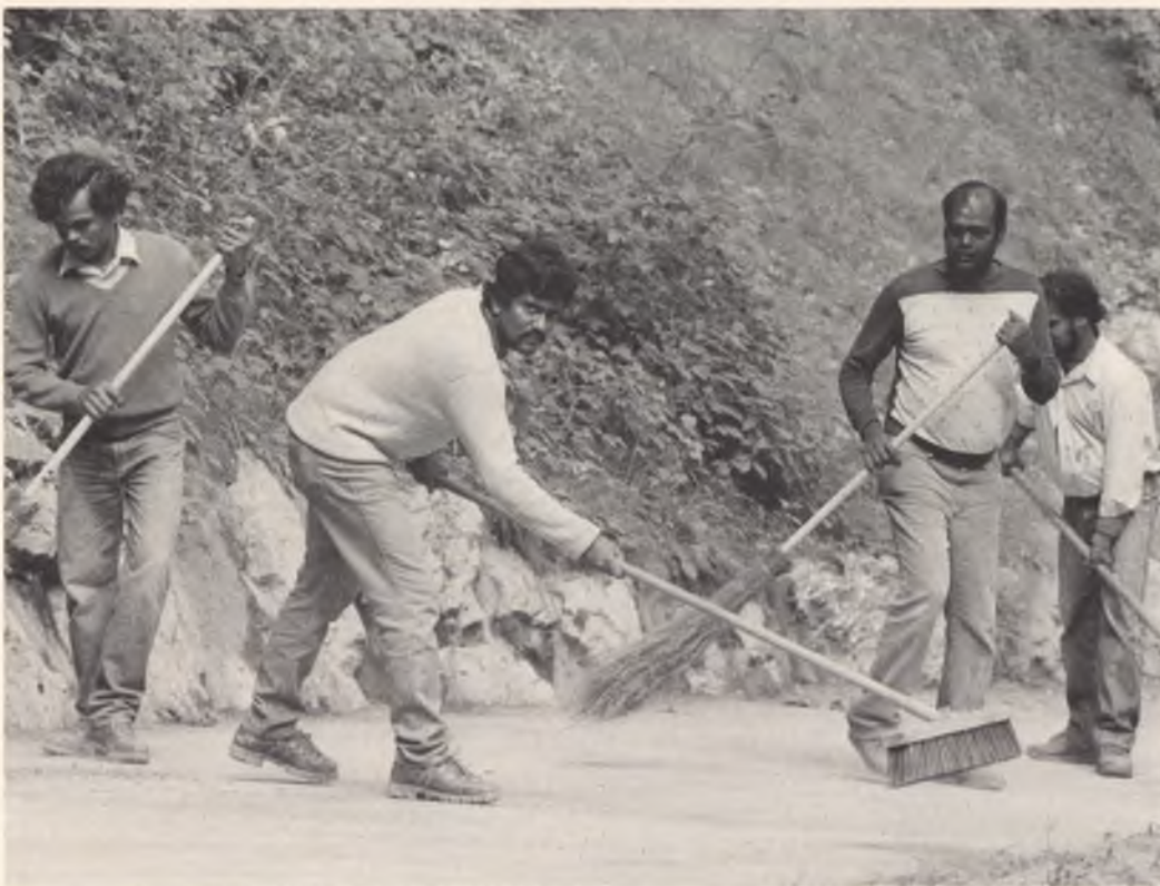
In vielen Kantonen haben sich Beschäftigungsprogramme für Asylbewerber bewährt. Diese Idee soll weitergeführt werden.

durch unsere eigene offene Haltung den Asylbewerbern und den Ausländern generell gegenüber dem Volk signalisieren, dass wir nicht fremdenfeindlich, sondern an sich gastfreundlich sind. Dazu gehört aber auch, verständlich zu machen, dass wir nicht jedermann bei uns beherbergen können. Wir sind ein kleines Land, unsere Möglichkeiten sind beschränkt. Dazu kommt, dass wir schon heute einen sehr hohen Ausländerbestand haben. Auch im internationalen Vergleich gemessen, ist unser Bestand an Asylbewerbern sehr hoch. In Europa herrschen nur noch in Dänemark ähnliche Verhältnisse wie in der Schweiz.»