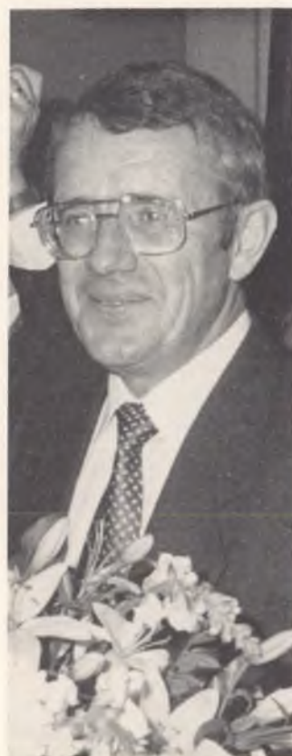
Bundesrat Arnold Koller