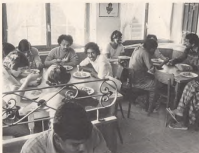
Blick in ein Asylantenheim bei Bern.

Geredet und geschrieben wird zwar immer von der Asylgesetzrevision bzw. vom Referendum gegen diese Vorlage. In Tat und Wahrheit stehen aber zwei Gesetze zur Debatte, und in der Volksabstimmung werden auf dem Stimmzettel zwei Fragen zu diesem Thema zu beantworten sein. Einerseits geht es tatsächlich um eine Revision des 1979 geschaffenen Asylgesetzes. Sie beinhaltet Neuerungen wie die Asylgewährung in Ausnahmesituationen, die sogenannten Grenztorer, die Verfahrensvereinfachungen oder die Verteilung der Asylbewerber auf die Kantone. Geändert wurde aber auch das Bundesgesetz über Aufenthalt und Niederlassung der Ausländer (ANAG) aus dem Jahre 1931. Diese Revision enthält vor allem die Ausschaffungshaft sowie die verbesserten Grundlagen für die Internierung von Ausländern. R.M.