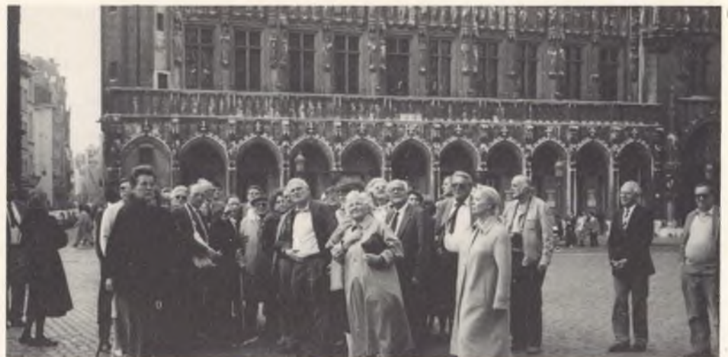
Die Reisegruppe der SSG auf der Grand'Place in Brüssel.

mener. Warum heisst die Botschaft Mission? Wesentlicher Unterschied ist das Fehlen konsularischer Aufgaben. Dafür aber ein gerütteltes Mass an wirtschaftlichen und politischen! Die Mission ist das Ohr der Schweiz am Puls Europas. Die Schweiz ist ein geachteter Partner der EG, naturgemäss ohne jegliche Beteiligung an Entscheidungsprozessen, aber willkommen durch ihre Präsenz und ihr Urteil. Das lebhafteste Gespräch dehnt sich beim Aperitif in den als Foyer benützten Vorräumen aus bis über den üblichen Feierabend der Diplomaten. Herzlichen Dank den grosszügigen Gastgebern. Die engen Gassen der wunderschönen Altstadt Brüssels sind für jeden Besucher ein Erlebnis. Auch für unsere Reisegesellschaft waren sie Abwechslung und Erholung nach anstrengenden Stunden und einem reichlichen Nachtessen in echt belgischer Atmosphäre. Bunte gemischte Menschenmengen bewegen sich noch um Mitternacht durch die Gassen und auf der lichtüberfluteten Grand'Place! Beim Frühstück auf der Dachterrasse des Hotels Atlanta öffnet sich uns erstmals der Blick über die Millionenstadt bis hin zum weit ent-