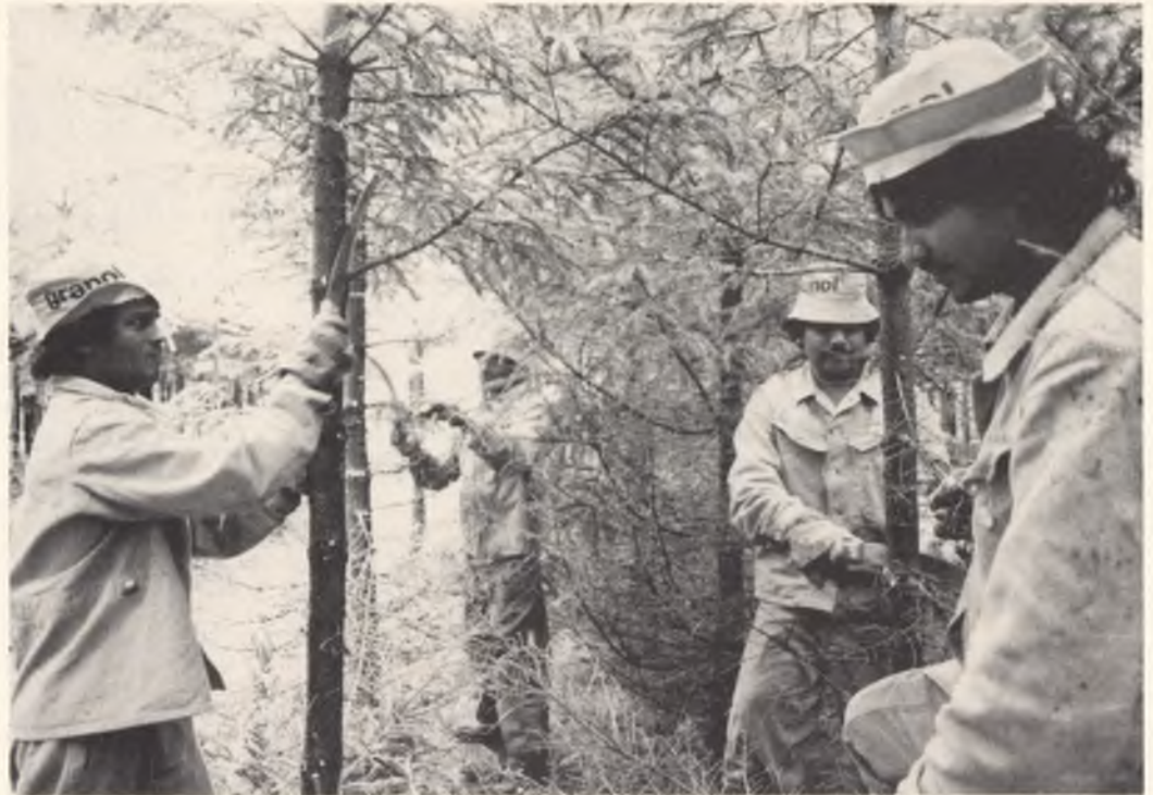
Asylbewerber im Einsatz in der Schweiz. So lernen sie auch die Arbeitswelt kennen.

ist bemerkenswert, auch wenn davon keine Wunder erwartet werden dürfen. Denn sie deutet darauf hin, dass das Flüchtlingsproblem zentraler gesehen wird als bisher. In der Entschliessung werden ausdrücklich alle Staaten dazu aufgerufen, in ihrem Lande keine Bevölkerungsgruppen politisch, wirtschaftlich, kulturell oder sozial zu diskriminieren und sie so zur Flucht zu treiben.