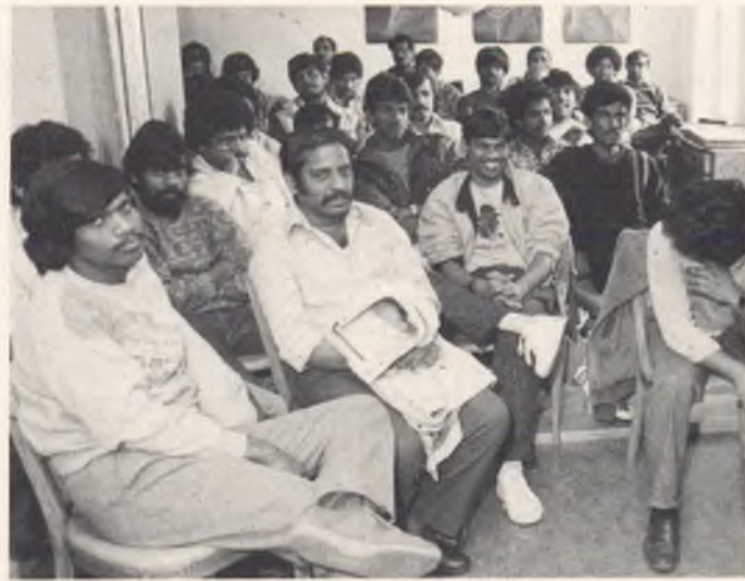
In früheren Jahren zeigte sich die Flüchtlingsproblematik anders als heute, wo viele Menschen anderer Hautfarbe und mit uns fremden Kulturen zu uns stossen (Bild).

Augenfällig ist – trotz «fortschrittlichem Sozialismus» oder eben deswegen – das Altmodi-