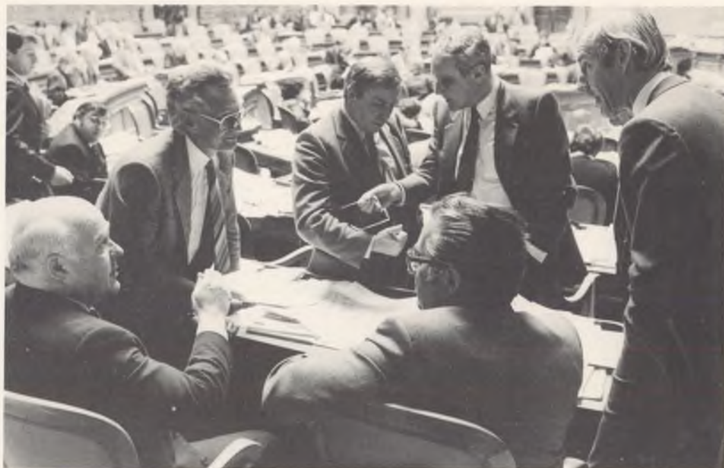
Das Parlament musste sich wiederholt mit Asylfragen befassen. Ein Ergebnis der parlamentarischen Arbeit gelangt am 5. April zur Abstimmung.

Hat es mit diesen drei Revisionsgründen sein Bewenden, oder spielen da nicht auch noch andere Motive mit hinein? Die Revision fand in einer Zeit statt, da sich die Nationale Aktion (NA) und ähnlich gelagerte Gruppierungen im Aufwind befanden, so dass der Verdacht