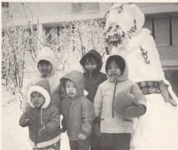
Viele Flüchtlinge erfahren eine eher kühle Aufnahme in der Schweiz – nicht nur aus meteorologischen Gründen wie hier vietnamesische Kinder 1979.

Am 17. April 1975 mussten die Soldaten kapitulieren. Gleichzeitig klopfte die Rote Armee an die Türen aller Häuser und befahl den Einwohnern, die Häuser innert 24 Stunden zu verlassen. Ausser Reis und Salz durften keine Sachen mitgenommen werden. Wir sollten eine neue Existenz auf den Reisfeldern aufbauen. Durch die Medien wurden die ehemaligen Offiziere, Soldaten und Funktionäre von der roten Regierung einberufen. Man sagte ihnen, sie sollten den Prinzen