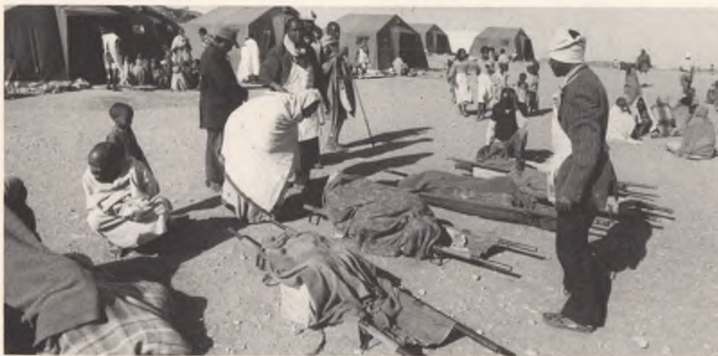
Menschen auf der Flucht: Millionen sind gezwungen, eine neue Heimat zu suchen.

Millionen von Menschen werden jedes Jahr durch Bürgerkriege, politische Wirren, Naturkatastrophen und Wirtschaftskrisen zur Flucht aus ihren Heimatländern getrieben. Viele versuchen, in Nachbarländern unterzukommen, leben in Flüchtlingslagern, haben die Hoffnung, nach Hause zurückkehren zu können oder allenfalls anderswo eine neue Bleibe zu finden. Viele dieser Menschen machen auf der Suche nach der persönlichen Zukunft weite Reisen, zum Beispiel in die Industriestaaten des Westens. Und einige von ihnen gelangen so auch in die Schweiz.