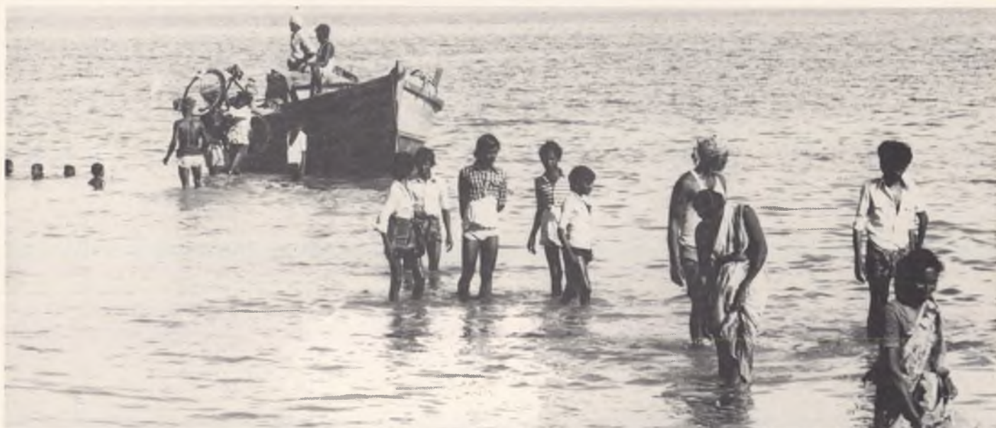
«Boat People» – Bilder, die die Welt erschütterten. In oft abenteuerlichen Fahrten übers Meer gelangten viele in die Freiheit. Wie viele dabei umkamen, weiss niemand.

tal, das unter der Leitung des Roten Kreuzes stand, zu erkundigen. Schliesslich wurde ich von einem amerikanischen Arzt in seiner Equipe aufgenommen. Wir pflegten kambodschanische Patienten im Flüchtlingslager Khao I Dang. Während der acht Monate, in denen ich mit den kambodschanischen Patienten arbeitete, stellte ich fest, wie stark die seelischen und physischen Belastungen der kranken Menschen waren. Später wurde ich ins Flüchtlingslager Chhun Buri gebracht. Dort durfte ich