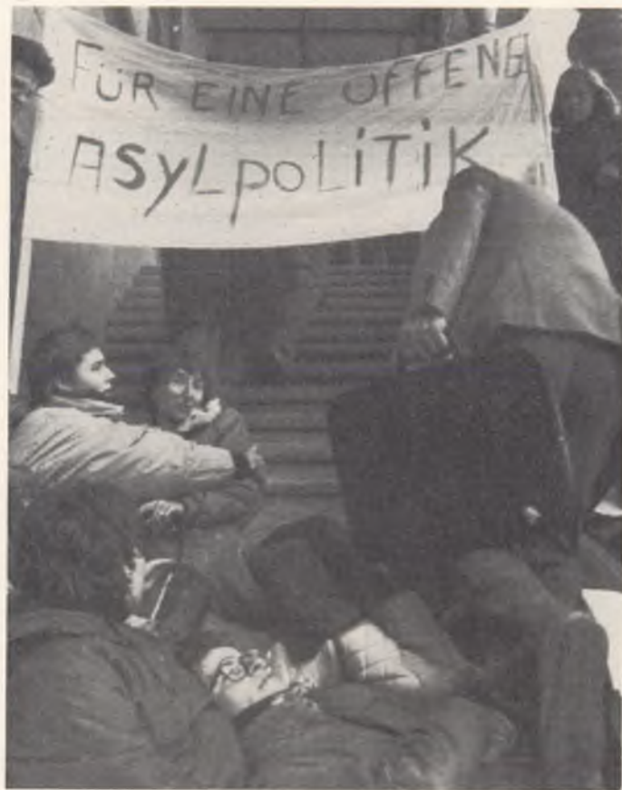
Asylpolitik beschäftigt die Öffentlichkeit. Diese Aufnahme zeigt eine Kundgebung, an der eine offene Haltung der Schweiz gefordert wurde.

der Ausreisekosten durch den Bund. Im Vordergrund soll aber nicht das Geld, sondern die Rückkehrberatung stehen. Auch die aktive Suche nach dauerhaften Lösungen im Sinn der Wiedereingliederung in Dritt- oder Herkunftsstaaten der Asylbewerber hat sich der Bund jetzt zur Pflicht gemacht.