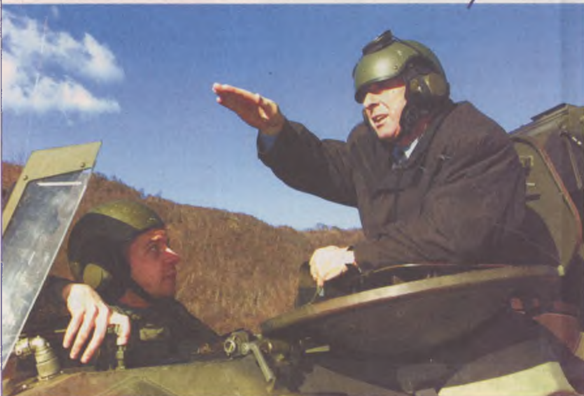
Bundespräsident Adolf Ogi dreht in einem Panzerjäger eine Runde anlässlich eines Truppenbesuchs im Tessin.

Am 26. November stimmen wir neben den Initiativen für ein flexibles Rentenalter auch über die «Umverteilungsinitiative» ab; sie will die Ausgaben für das Militär halbieren. Wenn diese Initiative angenommen wird, kann ein Teil der eingesparten Milliarden für die AHV und das flexible Rentenalter verwendet werden. Wir werden auch dann noch eine der teuersten Armeen in Europas besitzen.