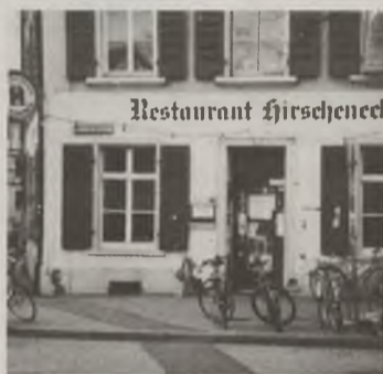
Das «Hirschenek» am Lindenberg 23 in Basel.