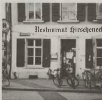
Das «Hirschenkeck» am Lindenberg 23 in Basel.