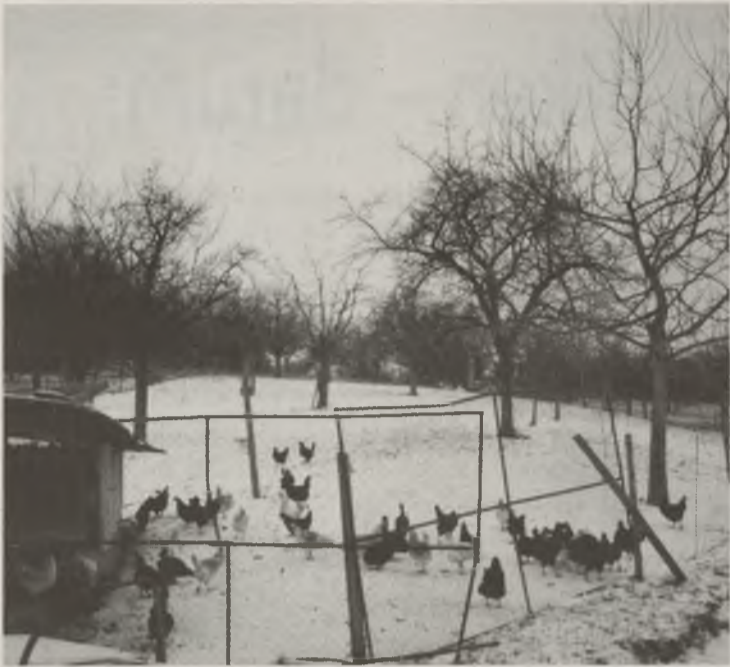
Auslauf im Winter: bei der KAG eine Selbstverständlichkeit! Für Rindvieh im Anbindehaltung gilt: mindestens eine Stunde Auslauf pro Tag – zum Beispiel während des Tränkens, wie hier im Bild.