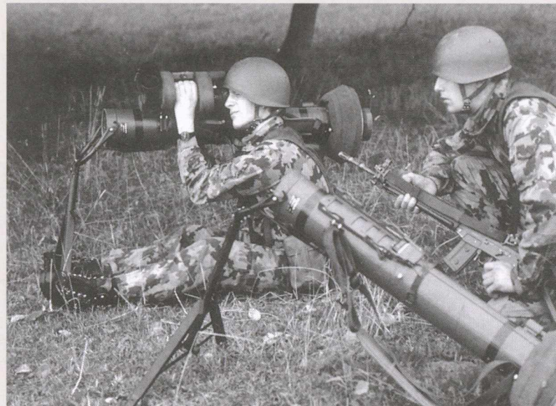
Vom Schweizer Soldaten wird verlangt, dass er für den Schutz unseres Landes notfalls sein Leben hergibt.

Der Selbstbehauptungswille und die militärische Landesverteidigung der Schweiz gründen auf dem Gedanken des Widerstandes. Unsere Widerstandsarmee dient der Verteidigung. Sie mischt sich nicht in fremde Angelegenheiten. In der Milizarmee ist der Bürger gleichzeitig auch Soldat und somit Träger des Widerstandes.