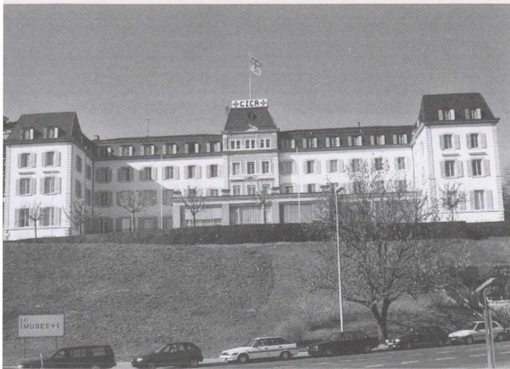
IKRK-Gebäude in Genf: Ausgerechnet der Depositärstaat des Internationalen Komitees vom Roten Kreuz (IKRK) würde endgültig zur Marionette der interventionistischen Grossmachtpolitik.

daten wäre der Griff zur Waffe unvermeidlich. Wer würde nach den Schüssen noch unterscheiden, ob es nun Notwehr der neutralen Schweiz oder eine Aggression der «fremden Interventionsmacht» war? Die Schweiz würde zur Kriegspartei. Sie würde ihr Ansehen und ihre humanitäre Tradition als neutraler Kleinstaat verlieren. Ausgerechnet der Depositärstaat des Internationalen Komitees vom Roten Kreuz (IKRK) würde endgültig zur Marionette der interventionistischen Grossmachtpolitik.