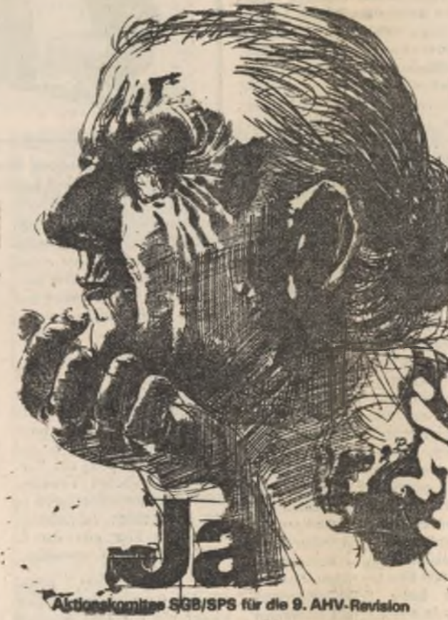
Hans Erni, der bekannte Grafiker und Künstler, hat 1948 an der Wiege der AHV für dieses bedeutende Sozialwerk geworben. Jetzt, wo es um das Überleben der Altersversicherung geht, stellt er erneut seine künstlerische Gestaltungskraft für die 9. AHV-Revision zur Verfügung.