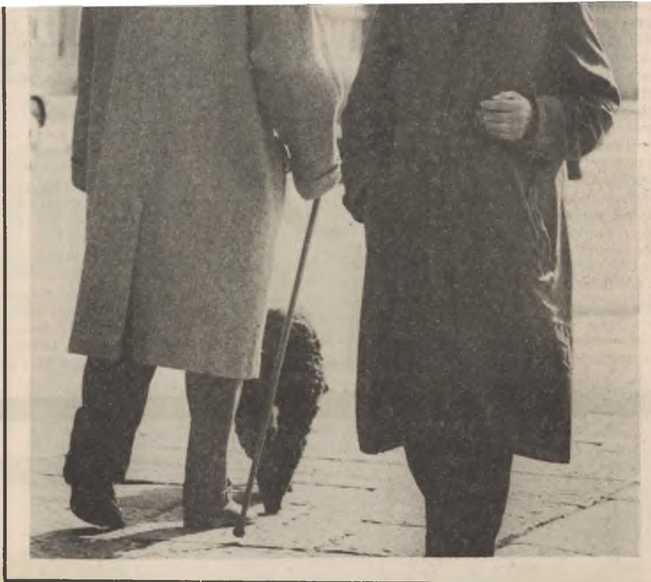
Zurück zum Almosen-Staat oder vorwärts zu einem menschenwürdigen Leben auch nach der Pensionierung? Die Antwort heisst: Ja zur 9. AHV-Revision.

Aber auch die Rentner tragen zur Konsolidierung bei durch Neufestsetzung der Grenzen für die Ehepaarsrente und der Zusatzrenten für Ehefrauen. Daneben werden die Beiträge der gut verdienenden Selbständigerwerbenden, die man 1969, als Geld im Überfluss vorhanden war, kürzte, massiv erhöht. Nicht erhöht, sondern herabgesetzt werden die Beiträge der Selbständigerwerbenden, die ein steuerbares Einkommen von weniger als 24 000 Franken haben. So müssen heute Selbständigerwerbende mit einem Einkommen von 21 000 Franken 7,3 Prozent an die AHV zahlen, neu nach Annahme der 9. Revision nur noch 6,5 Prozent. Die