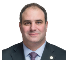
Michaël Buffat Indépendant et Conseiller national UDC

Pour beaucoup de jeunes, la SSR ne fait presque plus partie du quotidien. Nous nous informons via le streaming, les podcasts et les réseaux sociaux – mais nous payons quand même le montant plein. 200 francs, c'est plus juste et plus adapté à notre époque. Les jeunes ne devraient plus financer un service qu'ils utilisent à peine. L'initiative apporte une vraie équité et renforce la responsabilité individuelle plutôt que la contrainte.