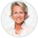
Andrea Gmür Ständerätin CVP