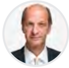
Beat Rieder Ständerat CVP