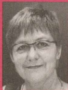
Cécile Bühlmann, Nationalrätin Grüne

Wir setzen auf zivile Friedensförderung und wehren uns gegen die Militarisierung der Politik. Nicht SoldatInnen, sondern die gestärkte Zivilgesellschaft, demokratische NGOs, staatliche Diplomatie und gerechte Wirtschaftsbeziehungen sind geeignet für die Umsetzung friedensstiftender Projekte.